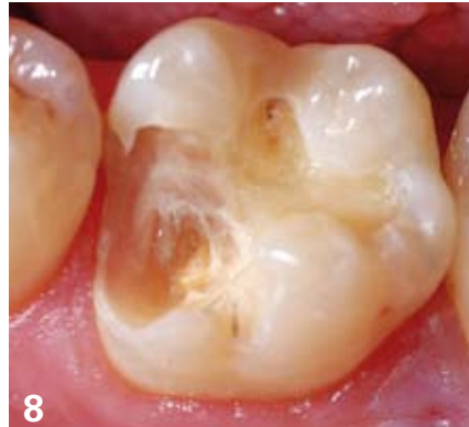
8. Cavité après élimination de l'obturation ; la préparation des limites proximo-cervicales, sans risque de lésions, semble difficile avec une instrumentation conventionnelle.