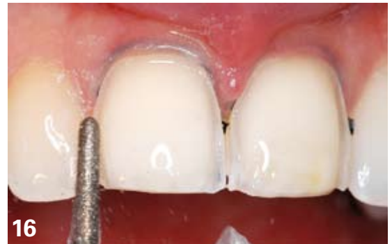
16. L'utilisation d'inserts infrasoniques permet une réduction contrôlée à minima et une précision importante des bords de la préparation. Ils facilitent également la pénétration instrumentale dans la zone du toboggan.