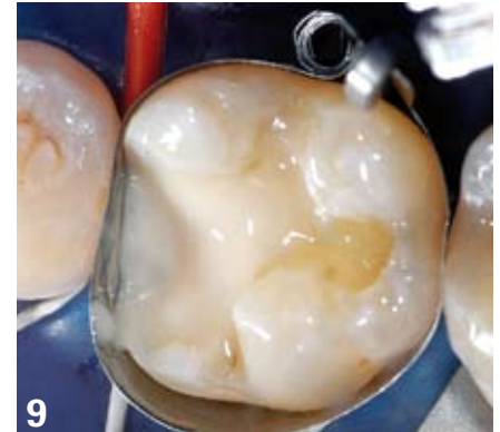
9. Procédure d'adhésion puis mise en place d'un substitut dentinaire (résine composite injectable), favorisant également un comblement des contre-dépouilles.