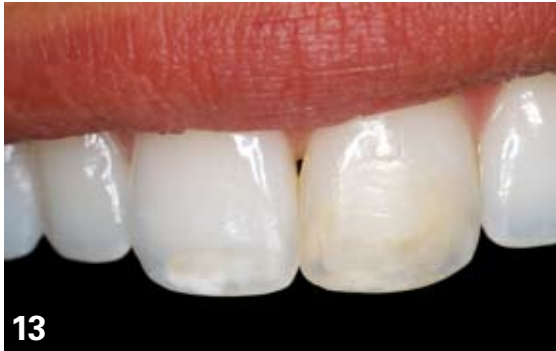
13. Cas clinique initial : à la demande de la patiente, insatisfait des traitements composites réalisés antérieurement, restauration intégrale des 11 et 21 porteuses de défauts amélo-dentaires profonds.

L'état de surface créé par la vibration sonore favorisera une empreinte d'une meilleure définition, à l'origine d'un joint prothétique de grande qualité mais également une meilleure adhésion du produit de collage [5, 11]. Fig 13 à 18