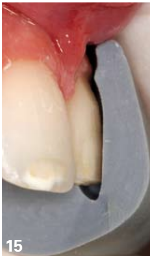
15. La mise en place du "guide vertical" permet de contrôler la réduction homothétique au volume final.