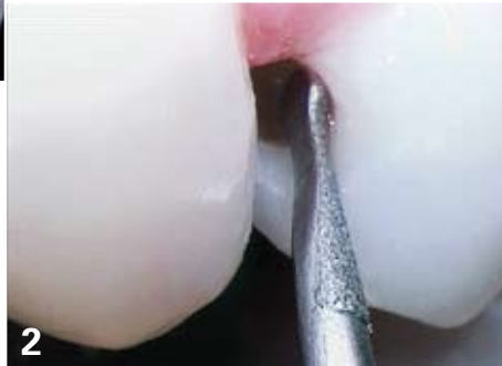
2. Insert Excavus (caméra Soprolife mode lumière du jour): débridement carieux à l'aide d'un insert de forme appropriée, permettant le maintien de la crête marginale supérieure et un nettoyage facilité sans aucune atteinte de la face distale de la dent latérale.