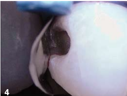
4. Matricage de la cavité slot (caméra Soprolife mode lumière du jour).