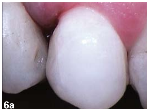
6. Image finale (caméra Soprolife mode lumière du jour) et radio postopératoire du soin achevé. Cas clinique : Dr Hervé Tassery.