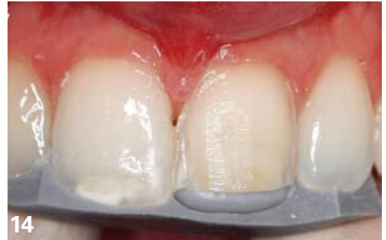
14. À partir d'une cire de diagnostic esthétique et fonctionnelle, un guide de préparation en silicone est réalisé puis découpé pour servir de "patron" aux préparations. Sur cette image, contrôle de la réduction du bord libre.