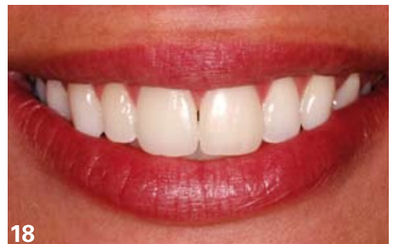
18. Bonne intégration des facettes réalisées à partir de la céramique IPS Empress EMax™ (Ivoclar Vivadent).