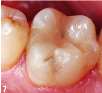
7. Situation clinique initiale : restauration composite OM infiltrée.

Pour ce type de restauration, les inserts soniques, associés aux instruments rotatifs, favorisent la divergence symétrique des parois et la protection des faces adjacentes. En effet, l'instrument rotatif ne franchit pas la région proximale pour ne pas risquer de toucher la face adjacente. Cette région sera facilement préparée et sans aucun risque pour la face adjacente, en utilisant un insert présentant une face lisse opposée à la face active. De plus, l'action des instruments rotatifs laisse souvent des zones cruentées, l'utilisation d'inserts soniques en complément apporte des formes de contours nettes et polies [15]. Fig. 7 à 12