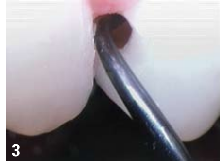
3. Vérification du débridement à l'aide d'un micro-excavateur (Hufriedy): la pénétration tissulaire aurait été bien plus mutilante avec des fraises conventionnelles!