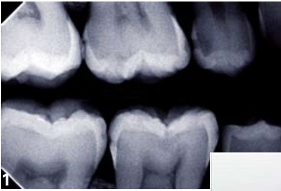
1. Radio préopératoire (dent n° 15): cavité carieuse inter-proximale stade I sans atteinte de la crête marginale.