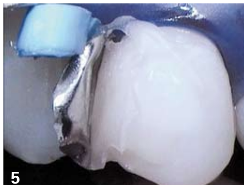
5. Injection d'un CVIMAR type Fuji II LC, matériau de choix pour les cavités « slot ».